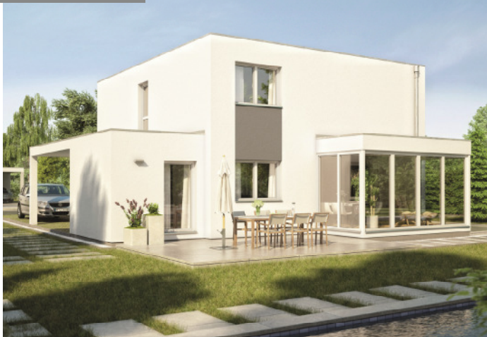
WALLFIT® SMART B Flachdach

*Alle gemachten Angaben sind ca. Angaben