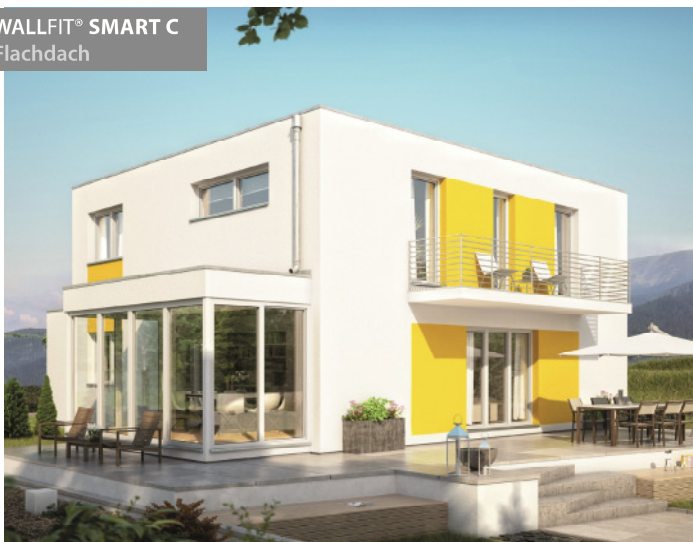
WALLFIT® SMART C Flachdach

*Alle gemachten Angaben sind ca. Angaben